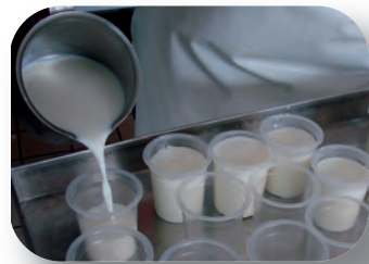
Mise en pots manuelle