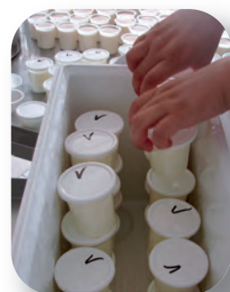
Étuvage en glacière

Bien utilisée, elle permet de conserver suffisamment de chaleur pour permettre à la fermentation de se dérouler correctement et obtenir ainsi le niveau d'acidité escompté.