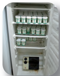
Congélateur recyclé en étuve à yaourts grâce à l'installation d'un convecteur électrique couplé à un thermostat