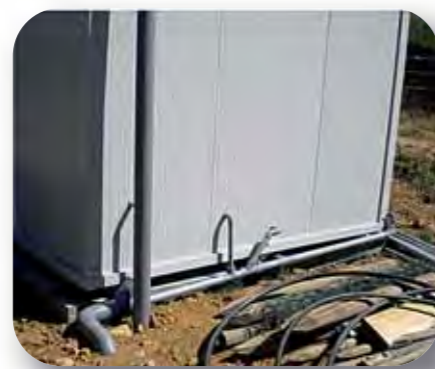
Raccordement des siphons de sol de la fromagerie modulaire au système de traitement des eaux usées, ici une fosse septique + épandage souterrain