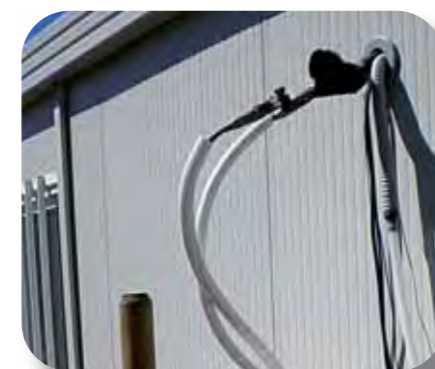
Raccordement au réseau électrique de la fromagerie modulaire