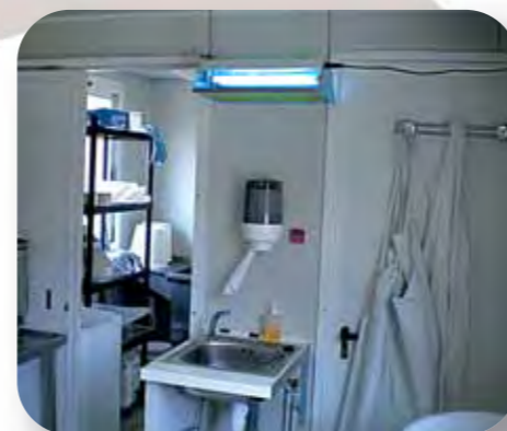
Salle de fabrication