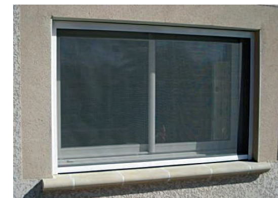
fenêtre à châssis ouvrant, équipée d'une moustiquaire

Dernier point, ne négligez pas la luminosité dans l'atelier. Rien ne vaut la lumière naturelle. Dans la mesure du possible, évitez les pièces « aveugles » (sans fenêtres). De la même façon que pour les portes, l'usage d'huisseries de qualité est à privilégier. Deux solutions sont alors possibles, les châssis fixes ou les châssis ouvrants. Le choix d'un châssis ouvrant diminue la surface de la fenêtre mais permet un renouvellement de l'air efficace. Dans ce cas, la mise en place d'une moustiquaire est nécessaire et à intégrer dans le plan de lutte contre les nuisibles. Notez que le PVC ou l'aluminium sont à privilégier pour des questions de durée de vie mais le bois reste autorisé sous réserve d'être peint avec une peinture alimentaire.