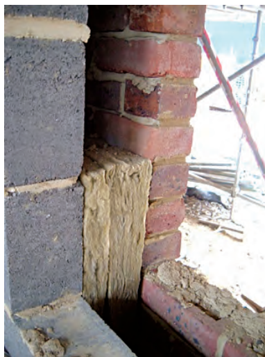
Mur constitué d'une base en parpaing béton, d'une isolation en laine de roche, d'un pare vapeur (ou frein vapeur) et d'un revêtement en brique de terre cuite.

La mise en place d'une porte isotherme, plus communément appelée porte frigo, est largement conseillée afin de limiter les transferts d'énergie.