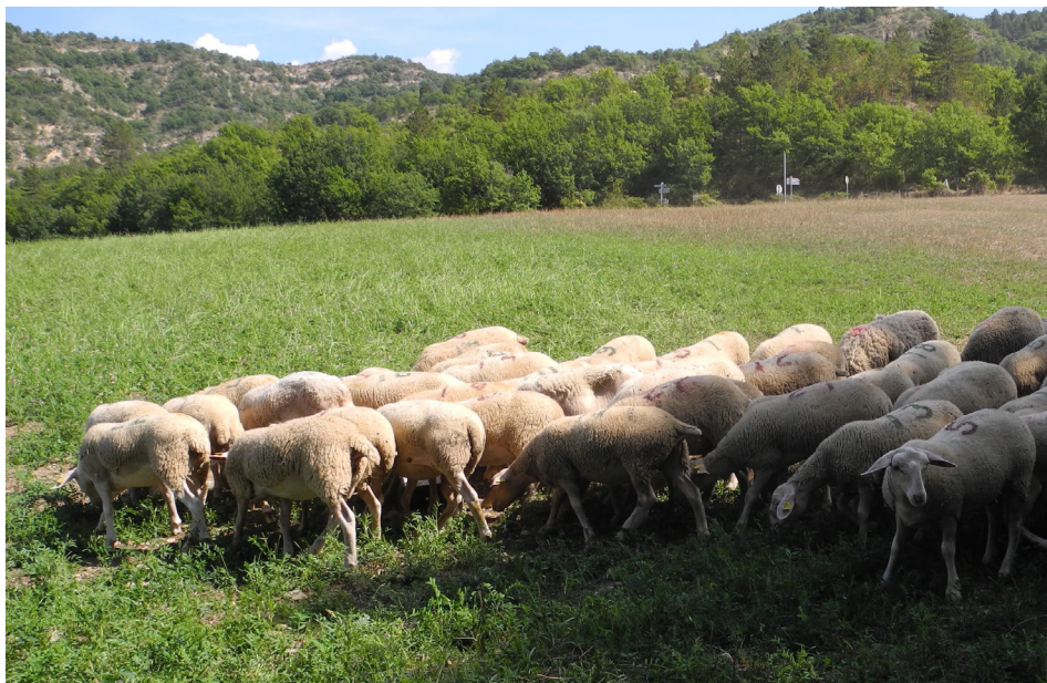
Agnelles sur sainfoin

Pour plus d'information, la chronique ovine « intérêt du sainfoin contre les strongles » https://mrepaca.fr/quel-interet-du-paturage-du-sainfoin-contre-les-strongles/ et Fastoche : « Tester le pâturage du sainfoin, du plantain et de la chicorée chez les petits ruminants : recueil des textes » https://idele.fr/detail-article/tester-le-paturage-du-sainfoin-du-plantain-et-de-la-chicoree-chez-les-petits-ruminants-recueil-des-textes